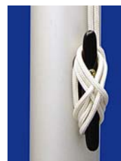
Klampe zum Festzurren des Hiss-Seils