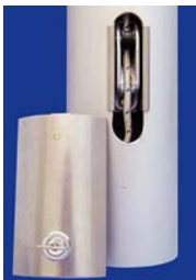
V2A-Masttür für innenliegende Hissvorrichtung abschließbar mit Zylinderschloß