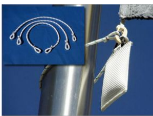
Halteschlaufe 450/ 550 / 650 / 750 mm