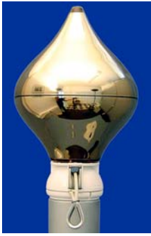
Mastkopf ZWIEBEL – gold aus Kunststoff – drehbar für innenliegende Hissvorrichtung