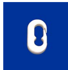
Kunststoffkarabiner zum Einhängen der Fahne