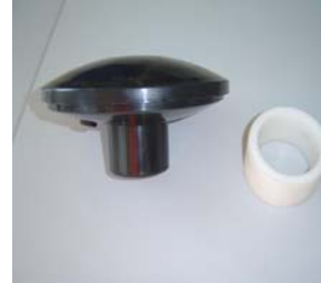
Mastkopf Ø 60 mm optional mit Reduzierring für Fahnenmast Ø 75 mm / Ø 90 mm