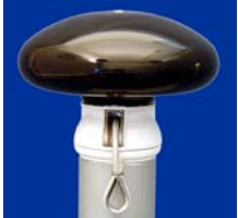
Mastkopf PILZ – schwarz aus Kunststoff - drehbar für innenliegende Hissvorrichtung