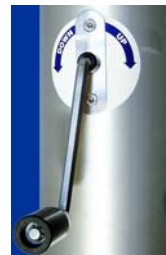
Kurbelsystem für ein bedienerfreundliches Hissen bei innenliegender Seilführung