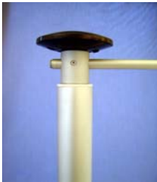
DREHKOPFAUSLEGER 360°drehbar zweifach kugelgelagert mit schwarzem Kunststoffkopf für Fahnenmasten Ø 60, 75 und 90 mm mit Auslegerstange für Fahnenbreite 1,00/1,20/1,50 m