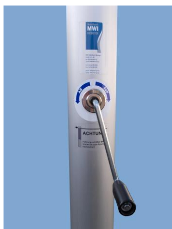
Aluminium-Bodenhülse mit Durchgangsschraube